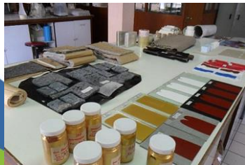
สีทาบ้าน

ประเภทลาเท็กซ์อิมัลชันและลาเท็กซ์โพลีเมอร์ของ APC เป็นส่วนประกอบ