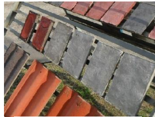
สีทากระเบื้อง หลังคา