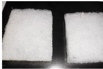
แผ่นใยสังเคราะห์ (Nonwoven)